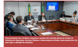
Representantes dos servidores expõem o perigo dos apertados prazos de entrega da Comissão de Desenvolvimento Econômico, Turismo e Infraestrutura do Estado, desta quinta-feira (6), para evitar a situação de apagão.

Servidores do DAER alertam para risco de apagão rodoviário no RS